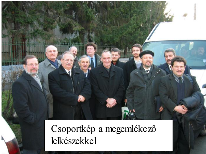
Csoportkép a megemlékező lelkészekkel

Nagyon nehéz volt ezeket a falvakat az úttalan utakon megközelíteni, a feneketlen sár miatt, ráadásul a nagy távolságok miatt is, lóháton vagy gyalog lehetett leginkább ezekbe kijutni. Septéren amikor építkezett, oda gyakran elvitt, mert az csak 5 km volt, egy hegyen mentünk keresztül gyalog. Én gyermeklány voltam abban az időben, távolabb nem vitt soha magával, csak odáig. Itt is volt egy kis birtokos a többiek között, aki ígért egy darab földet édesapámnak használatra. Tavaszra megbánta, és bevetette kukoricával. Estefelére varjúsereg lepte el a rosszul elboronált földeket, és kiszedték a fedetlen szemeket. Édesapánk csak későbbben értesült a dolgokról, de a birtokos mégis őt hibáztatta, mondván: „az ördöggel cimborál”, hogy őt tönkretégye. Apám csak sajnálni tudta butaságáért. Sokat ártottak népünknek, majdnem minden faluban uraságaink. Tisztelet a kivételnek!