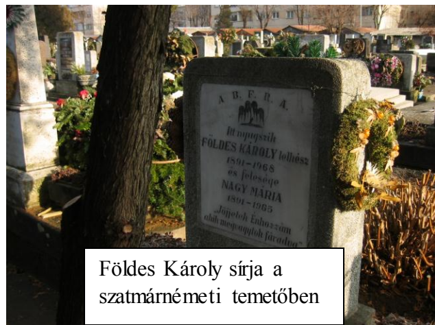
Földes Károly sírja a szatmárnémeti temetőben