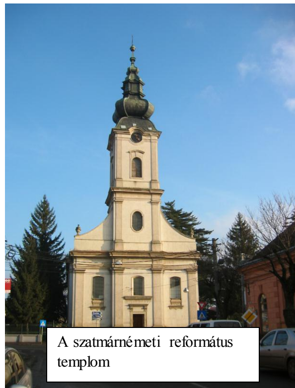
A szatmárnémeti református templom

Szerintünk Isten segítségével és édesanyánk hűségese gondviselése nélkül, apánk nem tudta volna ezt a rengeteg, emberileg szinte lehetetlen munkát elvégezni. Az ő mezőszéki szolgálata példa volt az utána következő lelkésznevezések, de példa lehet a mai fiatal szolgatársak előtt is a változó és modern világban.